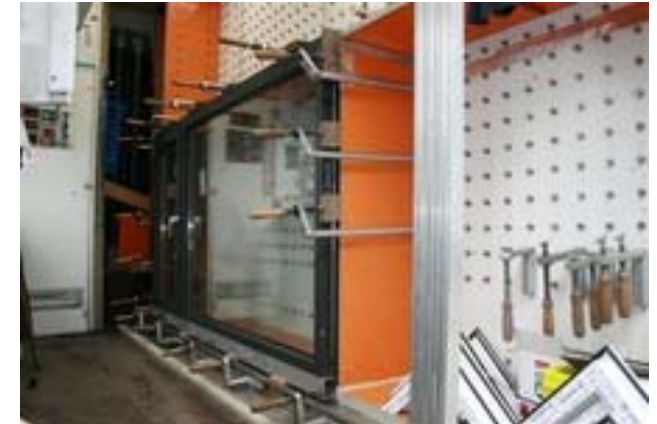
Testkastkeuring van een prototype

Naast een prototypetest, die in de regel éénmalig is, kan een visuele productiecontrole een algemene indruk geven van de kwaliteit op meerdere momenten: zijn de versteknaden dicht, zijn de rubbers op de juiste lengte en eventueel ge vulkaniseerd, zijn de glaslaten correct afgezaagd etc.