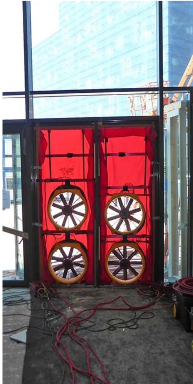
Blowerdoormeting na het wind- en waterdicht maken van het gebouw

Met visuele inspecties, vaak steekproefsgewijs, kan worden nagegaan of de dichtingen conform bestek, tekeningen en de lessen uit de testen zijn aangebracht. Niet zelden worden de details anders uitgevoerd dan vooraf bedacht, soms met verstrekkende gevolgen.